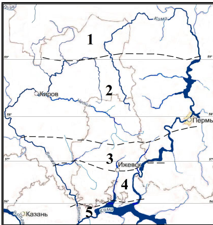
Рис. 1. Карта-схема зонального ботанико-географического подразделения ВКМ 3

Условные обозначения: Таяжная зона: 1 – подзона средней тайги; 2 – подзона южной тайги. Подтаяжная зона (смешанных лесов): 3 – подзона хвойно-широколиственных лесов (“липовых раменей”); 4 – подзона широколиственно-хвойных лесов (“орешниковых раменей”); 5 – территория, переходная к северной лесостепи. Границы и названия выделов даны с учетом работ А.Д. Фокина [1929], Л.А. Зубаревой [1997], С.А. Овеснова [1997], В.А. Шадрина [1999], О.Г. Барановой [2000б, 2002], О.Г. Барановой, И.Е. Егорова, В.И. Стурмана [2010].